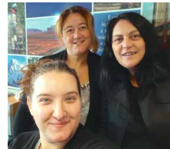
Il team Mugeltravel di Borgo San Lorenzo

scinanti del mondo, ma sempre più una scoperta di itinerari che nascondono bellezze talvolta sconosciute dal grande pubblico, mete tutelate da organismi mondiali o magari divenute patrimonio archeologico. E il nostro modo di lavorare alla lunga è stato apprezzato dagli utenti che ringraziamo perché hanno sempre risposto con grande apprezzamento ed entusiasmo alle nostre iniziative. Questo indubbiamente ci appaga sebbene comporti per noi un continuo iter di sperimentazione sulle novità. Una delle ultime è scaturita qualche mese fa proprio dalla lettura, su questa rivista, di alcuni reportage sul Turismo in Incoming. Abbiamo scoperto la grandiosità di questo settore di lavoro grazie a Michele Taccetti, del progetto China 2000 , e a Paolo Del Bianco, presidente della fondazione culturale Romualdo Del Bianco , con il suo movimento Life Beyond Tourism , che ci hanno preso per mano. Da loro vogliamo